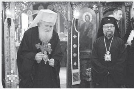
Негово Светейшество патриарх Неофит и Негово Високочество св. нисшездравстваният Старозагорски митрополит Кирил

Интересен факт е, че като епископ той носи титлата „Велички“, както и патронът на Богословския факултет на СУ „Св. Климент Охридски“.