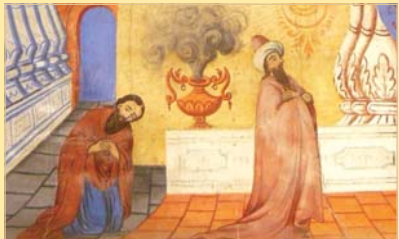
Степониц от храм „Св. архангел Михаил“, с. Студена. 1869 г., Коста Герев Античаров