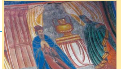
Степониц от църквата „Покров Богородичен“ в с. Боещица. 1886 г., Никола Образцов

Темата за Христовите притчи в монументалната църковна живопис на Българското възрождане е интригуваща по съдържание и проблематика, но все още не е добре изследвана. Обогатяването на иконографската програма и появата на сюжетите на новозаветните притчи, като завършен цикъл от иконографската програма, заслужава научен интерес от няколко различни перспективи – литературна, иконографска и културна.