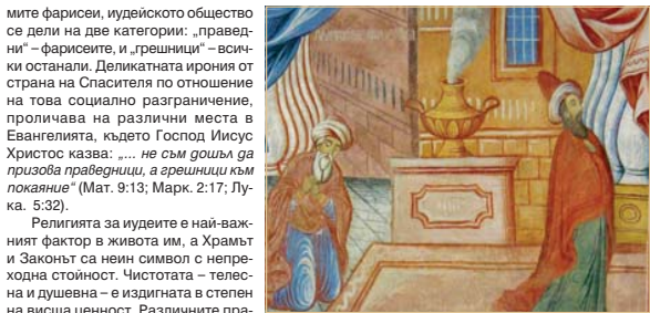
Степониц от Бельоната църква „Рождество Богородично“, Салонк. 1869 г., Никола Образцов

Фарисей означаваша на еврейски „отличаващ се“ и съгласно схващанията на са-