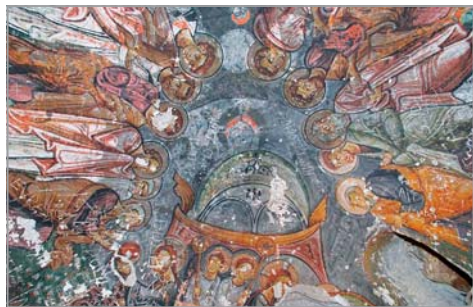
Продължение от бр. 3

Катедралата при гробницата „Селиме“ – това ми обещаха да видя, а спряхме пред голям скален масив, набразден от по-големи и по-малки отвори, в район осеян с причудливи островърхи каменни пирамиди. Пейзаж като от друга планета.