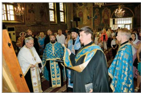
Празничен молебен пред чудотворната икона „Достойно ест“