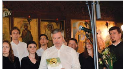
Връчване диплом на Синодалния хор на Московската патриаршия