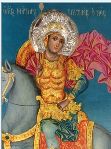
Св. Николай Нови. Икона от църквата „Св. Николай“, гр. Пловдив (детайл)

С голямо благоговение приела тежкобоаната попадия светената вода и на сутринта измила своите екзематозни рани, образувани от разчесване, и – о, безкрайни и свръхестествени