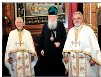
Ваше Високоблагозовейство, скъпи отец Кръстане, Отрано е в гошима празничен ден, в 6-тии благозоевний се прекланеме пред Честния Кръст Господен, да Ви поздравим всесърдечно и всеугодно по случай Вашата благозоевна 85-годишнина! Оце на третия ден след своето раждане в китното софийско село Железница Ви приемате светото Кръщение. От млада возраст сте възпитан религиозно-набствено, като вземате своя кръст и тръвасте след Христа (Марк. 8:34). Бог насочва Вашето ръководство може да предприеме действия, които официално писмено предупреждение към ръководството на медията, прекратяване на сътрудничеството и взаимодествието с нея, бойкотирание на медията и призоваване на върващите към бойкот. Както и обръщане към съответните държавни органи. Серюзен проблем във взаимодействието между Църквата и медияте би била и склонността у отделни медии да търсят сензация и скандал на всяка цена, отглед да задоволят невысокия вкус на своите потребители. Жажда, която Църквата не би могла да приеме и толерира, а оце по-малко да задоволява. Като отчитаме, че светските журналисти все по-компетентно и добросъвестно отразяват живота на Църквата, трябва да отбележим, че има неща, които са недопустими спрямо БПЦ и която и да е друга религиозна организация: оскърбление на религиозните символи, свещените писания, свещените имена и личности, както и на духовенството. Всеки явяващ – мосломинанин, юдеин, християнин – приема особено болезнено оскърбелни действия и изказвания, посегателства върху всичко сакрално за него. Наблюденията ни през последните години на засилен интерес към Църквата, и от страна на обществото, и от страна на медияте, показват, че обичайните материали за Църквата от страна на светските медии са: информация за същността и отбелязването на даден християнски празник, новини за актуални събития от живота на Църквата и публикации, търсещи скандали и сензации. Чести поводи за споменаване на Църквата в светските медии е и участието ѝ в официални светски събития. Тук е мястото да отбележим, че макар през последните години между БПЦ и светската власт да се установиха добри отношения на взаимно уважение и зачитане, не бива да се насажда разбирането, че Църквата е своеобразен придатък към държавния протокол при определени официални събития. Акцентът трябва да си остава върху вярата, нравствеността, духовните теми и събития. Светското общество търси да открие в лицето на представителите на Църквата примера за доброта, безкористност и безусловна любов, състрадание, отговори на вичните и злобулновните проблеми, а за съжаление, не винаги ги открива. Затова ние, свещенослужителите и явяващ църковен народ, сме длъжни да се стараем да бъдем такъв пример за нравствена чистота, кротост, безконфликтност и братоловие. Църквата, в наше лице, трябва да разговаря с широката общественост, защото вичните евангелски истини се нуждаят постоянно от ново осъзнаване, разпространение, популяризиране и действено актуализиране. Ако преди години Църквата и християнството нямаша място в общество, то сега можем да говорим, да присъстваме и участваме свободно в обществената живот. И ако не го правим, вината е само наша. Ние трябва да бъдем открити за отношенията с медияте, да се стремим да говорим на език понятен на съвременните хора – за журналистите и за тези, до които техните материали ще достигнат. И да имаме предвид, че ако ние, църковните люде, сами не говорим за Църквата, за църковния живот, други ще го правят. Колкото и както могат и искат. Снимките са от Квалификационния семинар за журналисти в Троянския манастир, 7-8 юни 2019 г.

Средствата за масова информация (СМИ) играят важна роля в съвременното общество. Те са призвани да поднасят на широките слоеве от обществото коректна и своевременно информация за важни събития от областта на политиката, обществените процеси, културата, традициите, спорта, в това число и от областта на църковния живот и православната вяра, да ориентират хората за случващото се в света и днешната сложна реалност. Но СМИ са не само източник на информация, а и силен и важен инструмент за формиране на общественото съзнание, обществените нагласи, нравствените устои и светогледа на личността. Ого защо те носят отговорността не само да се придържат към истината и проверените факти, но и да се съобразяват с определени нравствени принципи, заложени в етичния кодекс на журналистиката и личната човешка съвест.