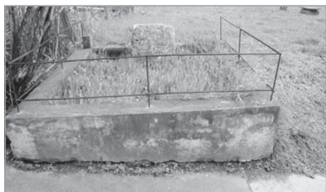
Възпоменателна плоча на Атанас Попкръстев, сложена от роднините и приятелите му на мястото, където е убит