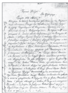
Писмо от Иванчо Попов до брат му Петър за смъртта на племеника им Атанас Попкръстев

Следващото десетилетие е белязано с активни действия от страна на българския народ и неговото духовенство, целящи признането на самостоятелна Българска църква.