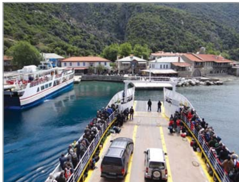
Пристигане на пристанището в Дафни