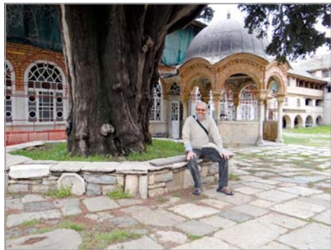
Пред църквата (католикон) във Великата Лавра