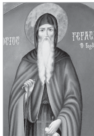
Сходните образи на преподобните чудотворци от Рилската и Йорданската пустиня (св. Йоан и св. Герасим)