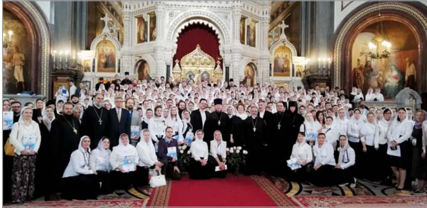
Сборният хор от 500 души – делегати на конгреса

Свещейният изтъкна също така и положителната роля на диригентските класове към духовните академии и по-конкретно подкрепата му за този клас в миналото, в качеството му на ректор на Санкт-Петербургската духовна академия и семинария. Той още подчерта, че „само това може да се говори за възможността за развитие на пев-