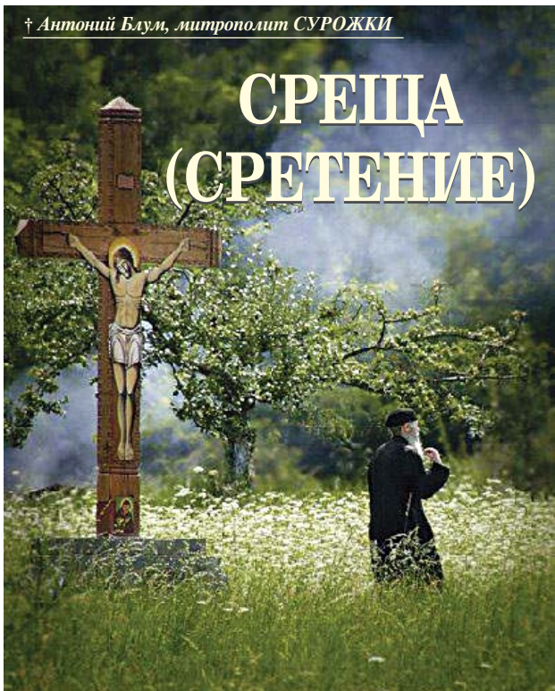
† Антоний Блум, митрополит СУРОЖКИ

по-горе споменах, че да виждаме не е достатъчно. Нужно е и да чуваме . Да чуваме е действие,