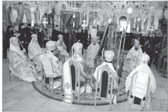
Архиерейският сонм по време на св. Литургия за юбилей

В края на богослужението Високопреосвещеният Пловдивски митрополит Николай произнесе слово, с което поздравя Великия епископ Сионий от името на Негово Светейшество Българския патриарх и Софийския митрополит Неофит, СВ. Синод на БПЦ-БП и христолюбивото паство на Пловдивската епархийска църква.