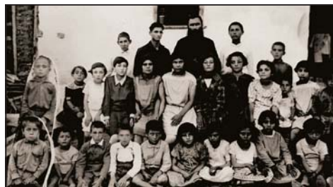
Паметна снимка от урок по вероучение