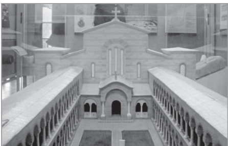
Макет на първата катедрала на Българската православна църква, IX век

На 4 март се изпълват 1150 години от основаването на Българската православна църква.