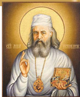
Св. Лука Симферополски, изобразен като хирург

Не по-малко разбираеми са техните ръчно изработени реплики на старинни и драгоценни църковни одежди, които днес се включват с мемориална цел в отделни празнични богослужения. А ефирните копирени одежди на гръцкото духовенство отдавна са