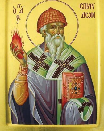
Св. Спиридон с плетената си пастирска сламена шапка във форма на кошница