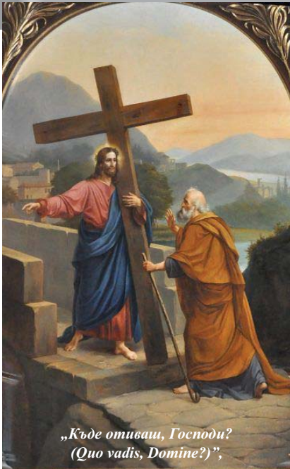
„Къде отиваш, Господи? (Quo vadis, Domine?)”,