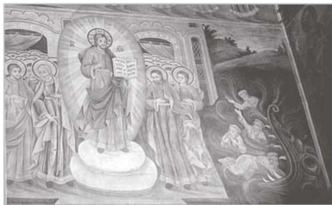
Стенопис на южната стена на главната църква в Рилския манастир. Димитър Христов и Зафир. 1844 г.

Тълкуването на този стих от Евангелието на св. ап. Йоан разкрива, че отхвърлили Христос и Неговото учение отхвърлят светлината, защото са възлюбили повече мрака, поради злите си дела.